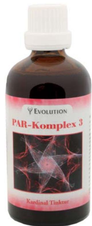
Kardinal Tinktur PAR-Komplex 3 Art. Nr. 3503, 100ml

Auflage: Betroffene Hautstellen, Thymusdrüse. Die Wickel helfen bei Hautproblemen, der Thymuswickel stärkt das Immunsystem.