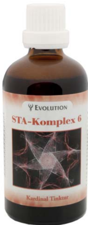
Kardinal Tinktur STA-Komplex 6 Art. Nr. 3506, 100ml

Herstellung nach spagyrischen Grundsätzen des Paracelsus