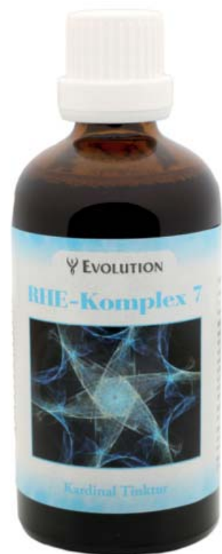
Kardinal Tinktur RHE-Komplex 7 Art. Nr. 3507, 100ml

Äußerlich: Zur Unterstützung der Entgiftung können auch Wickel und Packungen mit Terra Gold und 20 Tropfen der Tinktur auf die betroffenen Körperstellen aufgelegt werden. Auflage: Auf die betroffenen Körperstellen. Die Wickel und Packungen lindern Schmerzen und Entzündungen des Bewegungsapparates.