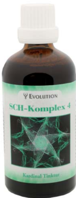
Kardinal Tinktur SCH-Komplex 4 Art. Nr. 3504, 100ml

Herstellung nach spagyrischen Grundsätzen des Paracelsus