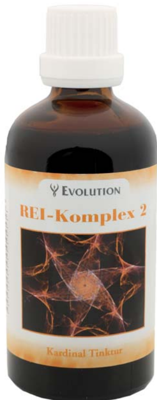
Kardinal Tinktur REI-Komplex 2 Art. Nr. 3502, 100ml

Herstellung nach spagyrischen Grundsätzen des Paracelsus