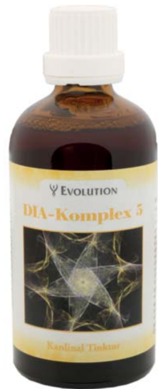
Kardinal Tinktur DIA-Komplex 5 Art. Nr. 3505, 100ml

Auflage: Bauchspeicheldrüse und Darm. Wickel wirken wohltuend auf die Bauchspeicheldrüse und den Verdauungstrakt.